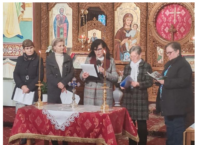
Evangeliën-Lesung (rumänisch, ungarisch, deutsch)