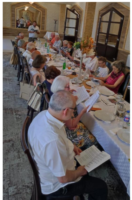
Gemeinsames Singen beim Seniorentreffen im „Imperial“

In der Gaststätte „Imperial“ wurde am Donnerstag, dem 3. Juli 2025 ein Seniorentreffen vom Presbyterium organisiert. Auf ein weiteres Seniorentreffen im Herbst wurde verzichtet, da (wie schon in den vergangenen Jahren nach der Pandemie) am